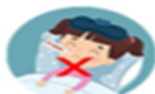
หลีกเลี่ยงการ สัมผัสใกล้ชิดผู้อื่น