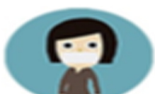
สวมหน้ากาก อนามัย