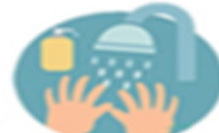
ล้างมือด้วยน้ำสบู่