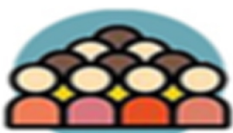
หลีกเลี่ยงการอยู่ใน พื้นที่แออัด/แออัด